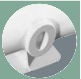
El nuevo tapón a fusión termoeléctrica